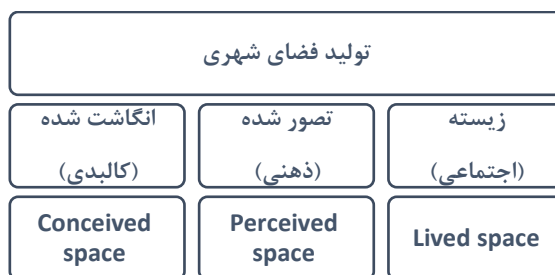
تصویر ۲: مدل تحلیل سه‌بعدی لوفور از تولید فضای شهری Fig. 2: Lefebvre's Analysis of the Production of Urban Space

در این بخش، از مدل تحلیل سه‌بعدی تولید فضای شهری لوفور (تصویر ۱) جهت مطالعه مصرف فرهنگی شهر پست‌مدرن استفاده‌شده است و درنهایت، چارچوب