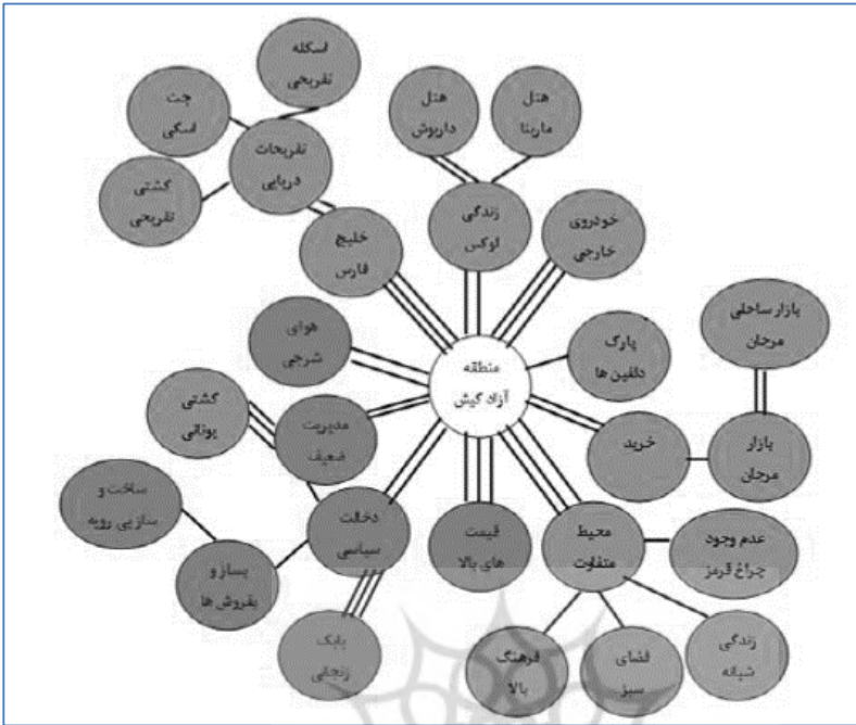
شکل ۲. نگاشت ادراکی جزیره کیش (نمونه پژوهش‌های پیشین)