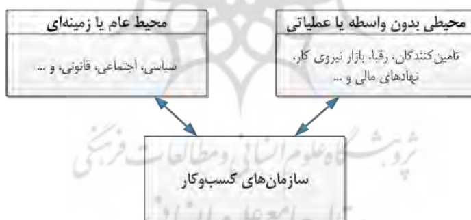
شکل ۲. تمایز محیط کسب‌وکار عام و بی‌واسطه در اثرگذاری بر بنگاه‌ها

یک سیستم اقتصادی مجموعه‌ای از نهادها، بنگاه‌ها، فرایندهای تصمیم‌گیری و الگوهای مصرف است که ساختار اقتصادی آن جامعه را تشکیل می‌دهند [۱۰]. محیط بیرونی یک کسب‌وکار را می‌توان به دو بخش محیط بیرونی عام، زمینه‌ای یا دور و محیط بیرونی بی‌واسطه، عملیاتی یا نزدیک تقسیم‌بندی کرد (شکل ۲) [۹]. در ادبیات مدیریت راهبردی کسب‌وکار، محیط بیرونی نزدیک به معنای فضای صنعت (تأمین‌کنندگان) و بازار (رقبا و مشتریان) دانسته می‌شود [۹؛ ۱۱].