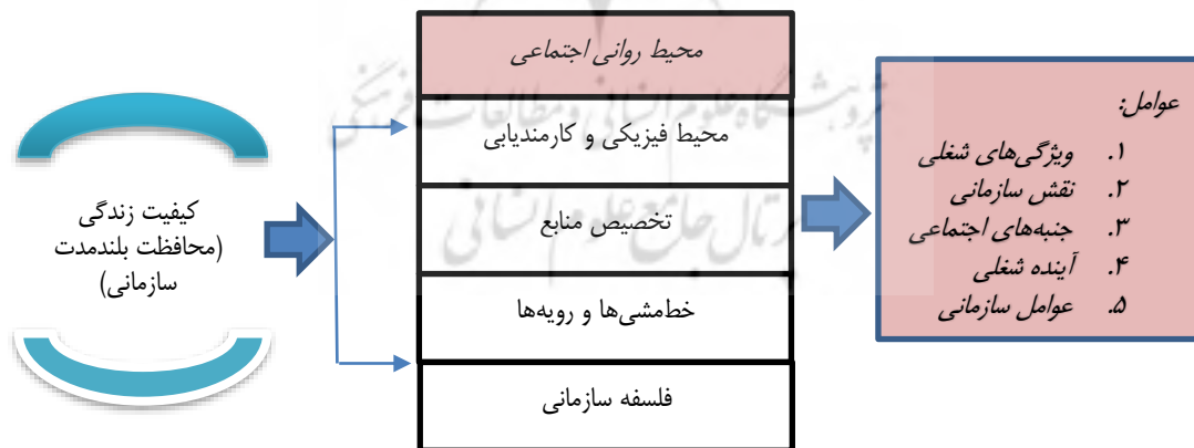
شکل ۱. چارچوب محیط روانی اجتماعی درمانی [۱۸]

در پژوهش دیگری چارچوب محیط روانی اجتماعی مطرح شده توسط بل ۱۱ [۱۸]، پنج مؤلفه (محیط روانی اجتماعی، نیروی انسانی و محیط فیزیکی، تخصیص بودجه، سیاست‌ها و رویه‌های سازمانی و فلسفه سازمانی) را در شرکت‌های مورد مطالعه در نظر می‌گیرد. هم‌چنین در مطالعه‌ای که توسط ورزاک و مورگان ۱۲ [۱۹] انجام شد، محیط روانی اجتماعی به پنج حوزه تقسیم شد که شامل ویژگی‌های شغلی، نقش سازمانی، جنبه‌های اجتماعی، چشم‌اندازهای شغل و عوامل سازمانی می‌گردند. ترکیب دو مدل اخیر مطرح شده در شکل شماره ۱ نشان داده شده است.