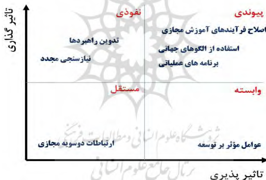
شکل ۲- نتیجه تحلیل میک‌مک

شکل ۲، نتیجه میزان وابستگی و قدرت نفوذ را برای هر یک از شاخص‌ها نشان می‌دهد. بر این اساس شاخص‌های نیازسنجی مجدد، تدوین راهبردها در منطقه نفوذی، شاخص ارتباطات دو سویه مجازی در منطقه خودمختار (مستقل) و شاخص عوامل مؤثر بر توسعه در منطقه وابسته و شاخص‌های اصلاح فرآیندهای آموزش مجازی، برنامه‌های عملیاتی و استفاده از الگوهای جهانی در منطقه پیوندی هستند. عوامل خودمختار شامل عواملی هستند که دارای قدرت نفوذ و وابستگی