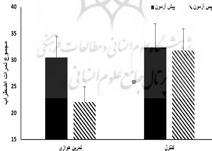
شکل ۱- نمرات اضطراب هر دو گروه در پیش‌آزمون و پس‌آزمون. *: کاهش معنادار نسبت به پیش‌آزمون.