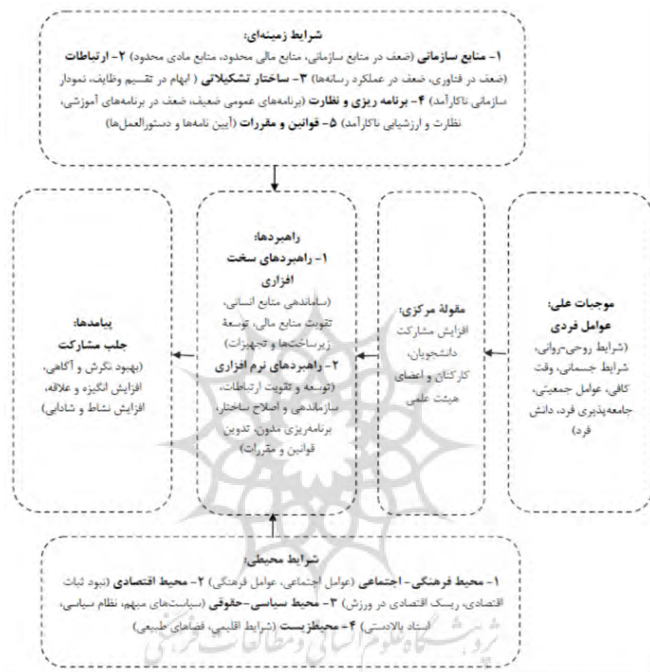
شکل ۲- مدل مفهومی توسعه ورزش همگانی دانشگاه آزاد اسلامی

طبق مدل مفهومی پژوهش حاضر که برگرفته از بیشترین نظرهای اعضای هیئت علمی دانشگاه آزاد اسلامی است، روابط ابعاد ورزش همگانی دانشگاه آزاد اسلامی و نحوه اثرگذاری این شاخص‌ها بر توسعه ورزش به بهترین نحو معرفی شده است. شرایط مداخله‌گر و زمینه‌ای در مدل، منطبق بر تهدیدها، فرصت‌ها، قوت‌ها و ضعف‌های وضعیت موجود دانشگاه آزاد اسلامی است که تاکنون در هیچ پژوهش دیگری به آن‌ها پرداخته نشده است. به نظر می‌رسد بتوان با آگاهی از این روابط و شرایط خاص درحال حاضر دانشگاه آزاد اسلامی (تغییرات پی‌درپی در نمودار سازمانی، تغییرات مدیریتی مکرر، وضعیت اقتصادی کشور، افزایش شهریه تحصیلی و ...) این امکان را برای اداره کل