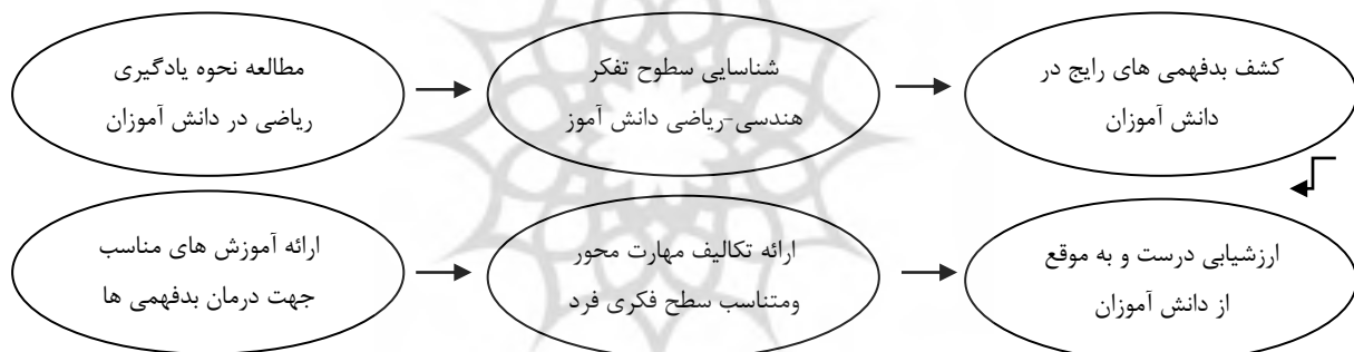
شکل ۱- مدل پیشنهادی برای تدریس در ریاضیات بر مبنای نظریه ون هیلی و بدفهمی های ریاضی و تکالیف مهارت محور

پژوهش های علمی بسیاری در حوزه آموزش و پرورش به منظور بهبود کیفیت تدریس معلمان در کلاس درس صورت گرفته است. بارها در کلاس درس بدفهمی ها و سردرگمی های ذهنی بسیاری از دانش آموزان را در دروس مختلف دیدیم. تمرکز اصلی ما در این پژوهش بر روی شناسایی نحوه یادگیری ریاضی در دانش آموزان، سطح تفکر هندسی آنان، شناسایی بدفهمی های رایج در آن ها، ارائه راهکارهای نوین آموزشی جهت درمان بدفهمی های دانش آموزان، ارائه تکالیف مهارت محور بر اساس سطح تفکر هندسی دانش آموزان و در نهایت ارزیابی دقیق و اصولی از دانش آموزان است. با بررسی منابع و پژوهش های مختلف از جمله نظریه ون هیلی، بدفهمی های ریاضی، تکالیف مهارت محور و پژوهش های مختلف حوزه آموزش ریاضی سعی در ارائه یک مدل یا الگوی آموزشی نوین برای یادگیری ریاضیات داریم. الگویی که سعی در ارائه آن داریم از ابتدایی ترین مباحث آموزش ریاضی یعنی شناخت این که دانش آموزان چگونه ریاضیات را یاد می گیرند و اساسا یادگیری ریاضی چه زمانی اتفاق می افتد شروع می شود و با استفاده از نظریه ون هیلی در مورد سطوح تفکر هندسی دانش آموزان، سطوح فکری هندسی - ریاضی آنان را شناسایی می کنیم سپس با استفاده از دستورالعمل های این نظریه متناسب هر سطح فکری دانش آموز، سعی در ارائه آموزش اصولی و مناسب دانش آموز به منظور رفع و درمان بدفهمی های رایج ریاضی آنان را داریم. سپس با استفاده از ارائه تکالیف متناسب و مهارت محور، علاوه بر بهبود یادگیری ریاضی آنان سعی در شکوفا ساختن استعداد ها و مهارت های آنان داریم و در نهایت با استفاده یک ارزشیابی خوب و متناسب یادگیری را در دانش آموز تثبیت می کنیم. الگوی یاد شده را در شکل یک مشاهده می کنید.