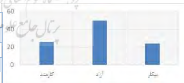
شکل (۷-۴-۱) شغل والدین دانش آموز شرکت کننده در تحقیق

جدول (۷-۴-۱) شغل والدین دانش آموز شرکت کننده در تحقیق