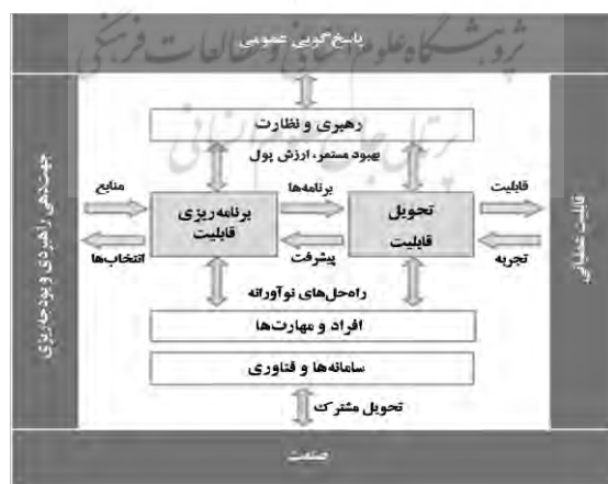
شکل ۱: نمایی از نظام اکتساب دفاعی انگلستان (۲۰۰۸)