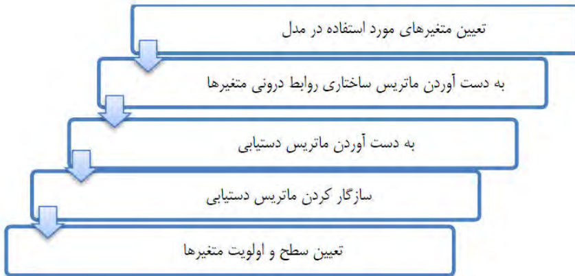
شکل 1- فرآیند مدل‌سازی تفسیری ساختاری در قالب یک الگوریتم (بهشت آیین و همکاران، ۱۳۹۷)

ISM می‌تواند در سطح بالایی از انتزاع مانند نیاز به برنامه‌ریزی بلندمدت به کار رود. هم‌چنین می‌تواند در سطح واقعی‌تری برای فرآیندسازی و جزئیات ساختار مرتبط با مشکل یا فعالیت مانند طراحی فرآیند، طراحی محصول، فرآیند مهندسی مجدد، مشکلات تکنیکی پیچیده، تصمیم‌گیری‌های مالی، منابع انسانی، تجزیه و تحلیل رقابتی و تجارت الکترونیکی به کار رود (Attri, Dev and Sharma 2013). مدل‌سازی ساختاری تفسیری یکی از ابزارهایی است که تعامل میان متغیرهای مختلف را نشان می‌دهد. مدل‌سازی ساختاری تفسیری، روابط متغیرها را به صورت روابط سلسله‌مراتبی نشان می‌دهد؛ بنابراین، این روش به منظور شناسایی و نشان دادن روابط بین اجزای مختلف که ممکن است روابط پیچیده‌ای داشته باشند، به کار می‌رود (Charan, Shanka and Baisya 2008). به دلیل اینکه رویکرد مدل‌سازی ساختاری تفسیری برای شناسایی و خلاصه‌سازی روابط بین متغیرهای تحقیق که یک مسئله یا موردی را تعریف می‌نمایند، به کار گرفته می‌شود، در این تحقیق از این رویکرد استفاده شده است چرا که این رویکرد، متغیرهای کیفی مورد نظر در تحقیق را اولویت بندی می‌نماید و ابهام موجود در روابط را به طور واضح و شفاف نشان می‌دهد. در واقع با رویکرد ISM، روابط بین ابعاد مسئله مورد نظر تعیین می‌گردد و شبکه روابط به صورت یکپارچه طراحی می‌شود.