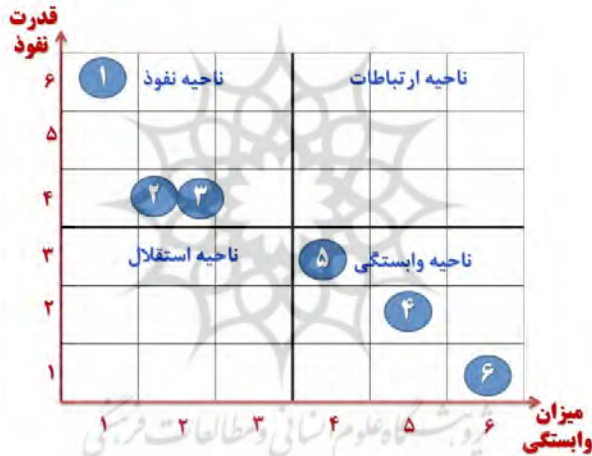
شکل ۳- ماتریس قدرت نفوذ و میزان وابستگی

در این گام ماتریس قدرت نفوذ-میزان وابستگی عوامل (ابعاد) مؤثر بر بهره‌وری استخراج شده که با توجه به قدرت نفوذ و میزان وابستگی در چهار ناحیه تقسیم‌بندی شده‌اند. این چهار ناحیه عبارت‌اند از: استقلال ۲۹ ، وابستگی ۳۰ ، ارتباط ۳۱ و نفوذ ۳۲ (عدم وابستگی). عواملی که حداقل میزان وابستگی و حداقل قدرت نفوذ را به دیگر عوامل داشتند، در ناحیه ۱ قرار گرفتند که آن را ناحیه‌ی استقلال گویند. این عوامل تا حدودی از سایر عوامل مجزا هستند و ارتباطات کمی دارند. ابعادی که میزان وابستگی زیاد و قدرت نفوذ کم به دیگر ابعاد داشتند، در ناحیه‌ی ۲ قرار گرفتند که آن را ناحیه‌ی وابستگی نامند. عامل‌هایی که قدرت نفوذ زیاد و میزان وابستگی زیاد و در واقع رابطه‌ی دوطرفه داشتند، در ناحیه ارتباطات قرار دارند که آن را ناحیه‌ی ۳ نامند؛ هرگونه تغییری در این نوع عوامل موجب تغییر در سایر عوامل می‌گردد. در نهایت متغیرهایی که نفوذ زیاد و وابستگی کمی داشتند، در ناحیه‌ی نفوذ (عدم وابستگی) قرار گرفته که به ناحیه‌ی ۴ معروف است. بر همین اساس نتایج تجزیه و تحلیل قدرت نفوذ و میزان وابستگی عوامل تحقیق حاضر در شکل زیر نشان داده شده است: