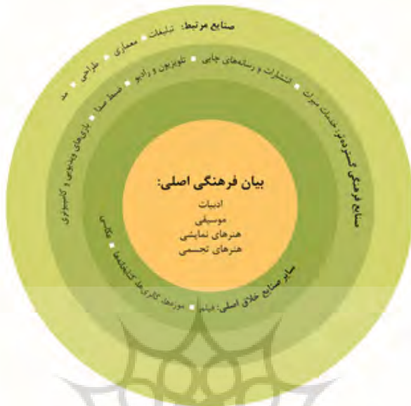
شکل ۱- مدل دایره‌های هم‌مرکز [۳۱]