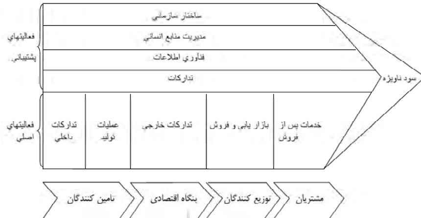
شکل ۱ - زنجیره ارزش پورتر [۲۴]

بر اساس دیدگاه پورتر، زنجیره‌ی ارزش شرکت در دامنه‌ی وسیع‌تری از فعالیت‌ها جایگزین مواردی از قبیل زنجیره ارزش مربوط به تأمین کنندگان رده‌های بالاتر و نیز مصرف کنندگان رده‌های بعدی یا هم-پیمانانی می‌شود که سرگرم توزیع و تحویل محصولات و خدمات به مصرف کننده‌ی نهایی هستند. نکته‌ی قابل ملاحظه این است که زنجیره ارزش در دنیای واقعی صنعت از زنجیره ارزش یک مؤسسه خاص متمایز است. شایان توجه است که زنجیره ارزش متعلق به محصولات تولیدی از زنجیره ارزش متعلق به خدمات به نحو بارزی متمایز است. به‌عنوان نمونه، اجزای اصلی زنجیره ارزش در صنایع کاغذسازی به شکل روشنی با عوامل تشکیل دهنده‌ی زنجیره‌ی ارزش در صنعت لوازم خانگی متفاوت است. زنجیره‌ی ارزش صنعت نوشیدنی‌ها با زنجیره ارزش صنایعی همچون صنایع خلاق (ازجمله پویانمایی، بازی‌های رایانه‌ای و...) نیز این چنین است. جدول زیر به برخی از مهم‌ترین مدل‌های موجود زنجیره ارزش در میانی نظری اشاره دارد.