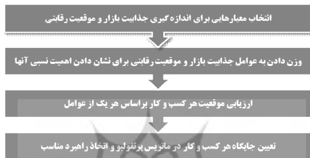
شکل ۲- مراحل طراحی یک ماتریس کسب و کار

بهره‌گیری از این روش، مدیران می‌توانند توان بالقوه آتی کسب‌وکارهای مختلف را با توجه به معیارهای یکسان مقایسه و نسبت به اولویت‌بندی و بهینه‌یابی حوزه‌های مناسب برای سرمایه‌گذاری اقدام نمایند. شکل ۲، مراحل طراحی یک ماتریس جذابیت بازار/موقعیت رقابتی را برای تجزیه و تحلیل کسب‌وکارها نشان می‌دهد.