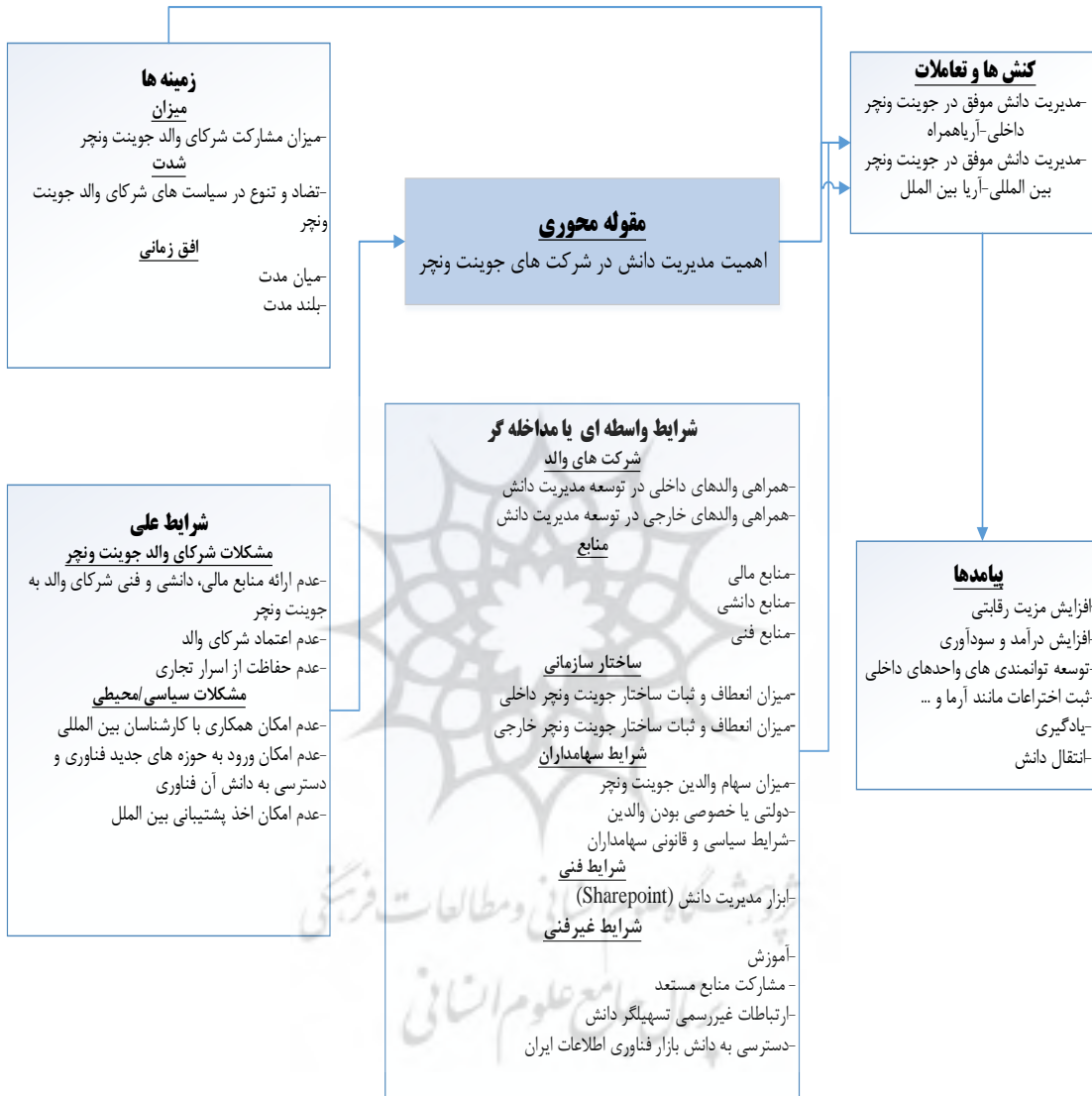
شکل ۳- مدل نهایی پژوهش

الگوبرداری و استفاده محض از مدل‌های مدیریت دانش شرکت‌های بزرگ و چندملیتی [و یا سرمایه‌گذاری مشترک] کاری اشتباه است. زیرا این شرکت‌ها با ساختار و بخش‌های مختلف کاری و پراکندگی بزرگ جغرافیایی در سطح کشورهای جهان، بسیار متفاوت از شرکت‌های مشابه ایرانی هستند. لذا باید از مدلی برای