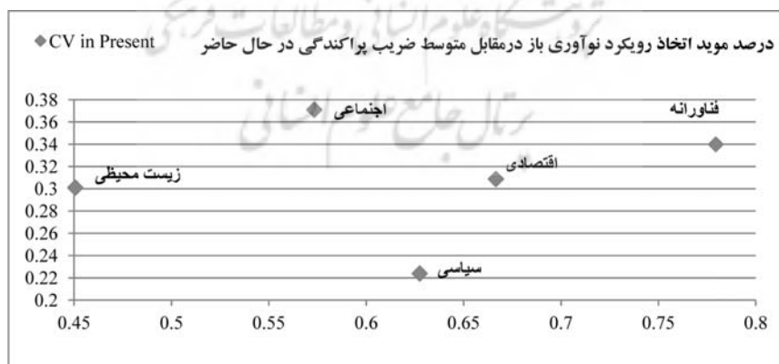
شکل ۲- مقایسه ی وضعیت صحت مؤلفه های شرایط زمینه ای با درصد مؤید اتخاذ رویکرد نوآوری باز

همانگونه که مشاهده می شود، بیشترین میانگین ها و کمترین ضرایب پراکندگی در سطح مؤلفه ها، که نشان دهنده ی بیشترین میزان صحت است، به ترتیب مربوط به پرسشهای مندرج در مؤلفه های سیاسی، زیست محیطی، اقتصادی، فناورانه، و اجتماعی است. اما بالاترین درصد رای به نوآوری باز، به ترتیب به پرسش های مندرج در مؤلفه های فناورانه، اقتصادی، سیاسی، اجتماعی، و زیست محیطی مربوط است.