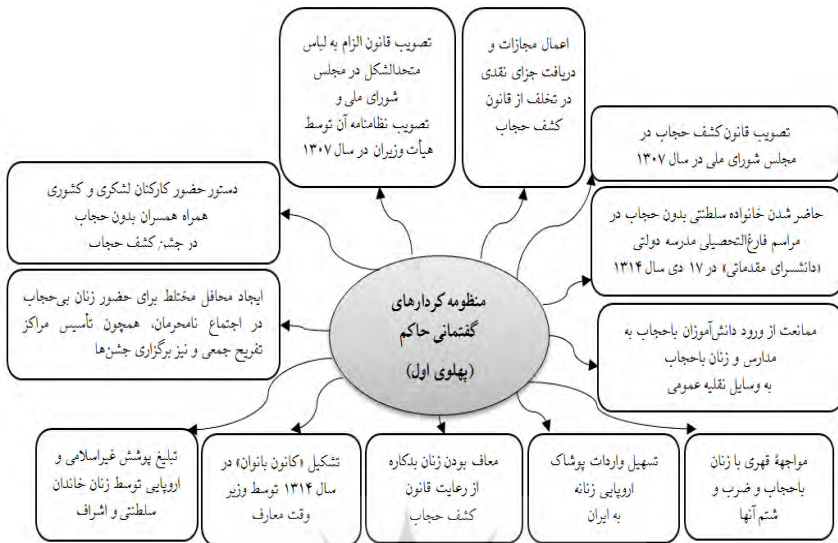
نمودار ۱. منظومه کردارهای گفتمانی حاکم در دوره پهلوی اول (۱۳۰۴ تا ۱۳۲۰ ش)

کردارهای گفتمانی پهلوی دوم برای تثبیت دال پوشاک مدرن زنان در حکومت پهلوی دوم، قانون ممنوعیت پوشش اسلامی به دلیل مخالفت‌های جدی مردم و علما که به درگیری‌های متعدد از جمله نزاع و کشتار در مسجد گوهرشاد مشهد در زمان رضاشاه منجر شده بود در سال ۱۳۲۳ ش لغو شد؛ گرچه محمدرضا شاه اقدام برای کشف حجاب را تأیید می‌کرد و پوشاک سنتی زنان را مانع اصلی زندگی اجتماعی آن‌ها می‌دانست (مجله سازمان زنان ایران، ۱۳۴۵: ۱۸). لغو قانون کشف حجاب در سال ۱۳۲۳ ش محدودیت بانوان متدین را برطرف کرد اما گفتمان حکومت دال بر تأیید و تبلیغ عدم رعایت حجاب از طریق فعالیت‌های فرهنگی سیاست‌گذاری شده، حفظ گردید و تداوم یافت؛ به عبارتی در دوره پهلوی دوم، حکومت درصدد بود، اهداف خود برای تغییر در پوشش زنان را با رویه‌های دموکراتیک دنبال کند (پهلوی، ۱۳۴۹: ۴۶۷) که اصلاح قوانین مدنی و قانون انتخابات در این دوره از جمله آن‌ها بود. در این باره نیز دربار محمدرضاشاه، به‌ویژه اشرف پهلوی خواهر شاه و نیز آخرین همسر شاه، نقش بسزایی داشتند.