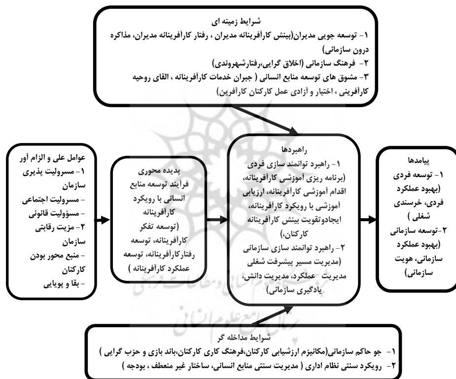
شکل شماره (۲): کدگذاری محوری توسعه منابع انسانی با رویکرد کارآفرینانه (یافته های نگارندگان)

کدگذاری محوری ۱ ، فرآیند ربط دهی مقوله ها به زیرمقوله ها، و پیوند دادن مقوله ها در سطح ویژگی ها و ابعاد است. این کدگذاری، به این دلیل "محوری" نامیده شده است که کدگذاری حول "محور" یک مقوله تحقق می یابد (استراوس و کوربین، ۱۹۹۸، لی، ۲۰۰۱: ۴۹). در مرحله محوری پژوهش فعالیت های توسعه منابع انسانی با رویکرد کارآفرینانه در قالب مقوله محوری در مرکز قرار گرفت. زیرا رد پای آن در بیشتر داده ها و مصاحبه ها مشاهده گردید. سپس بین سایر مقوله ها نسبت به پدیده محوری رابطه برقرار شد (شکل شماره ۲).