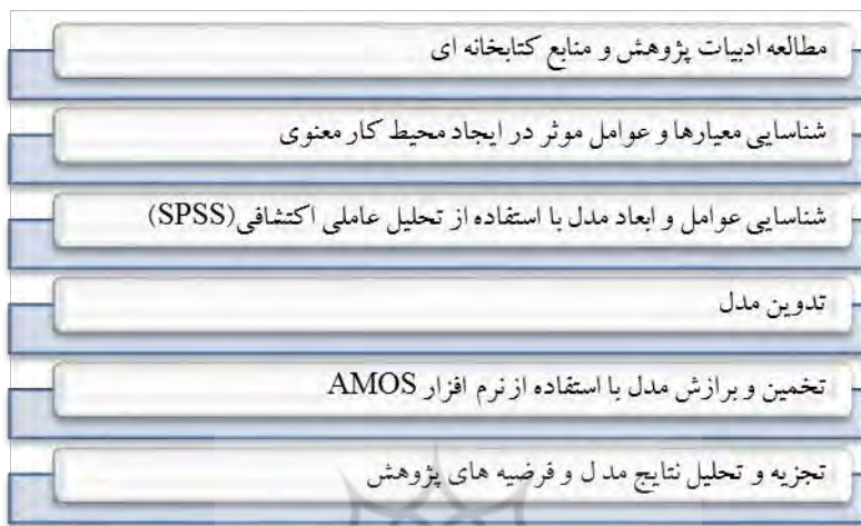
شکل شماره ۱- مراحل انجام پژوهش

و روایی پرسش نامه طراحی شده بر اساس آلفای کرونباخ و آزمون بارهای عاملی مورد ارزیابی قرار می‌گیرد. شکل شماره ۱ مراحل انجام پژوهش را نشان می‌دهد.