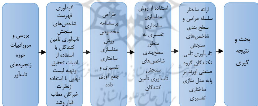
شکل شماره ۱: مراحل کلی اجرای تحقیق

بعد از محاسبه مقادیر فوق اگر مقدار دی‌فازی شده کمتر از مقدار شاخص مورد نظر باشد، شاخص مورد نظر تأیید شده و به مرحله اصلی تصمیم‌گیری وارد می‌شود. ولی اگر مقدار دی‌فازی شده کمتر باشد، شاخص مورد نظر رد می‌گردد. با توجه به روش تجزیه و تحلیل بیان شده و مراحل مختلف تحقیق به‌طور خلاصه می‌توان مراحل اجرای تحقیق را مطابق شکل یک بیان کرد: