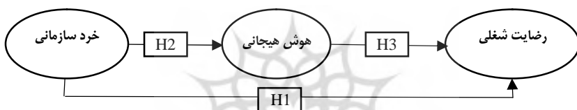
شکل شماره 1: مدل مفهومی پژوهش (محقق ساخته)

با توجه به مطالب فوق که برگرفته از تئوری‌ها و پیشینه در این حوزه است و اینکه متغیر مستقل خرد سازمانی بر متغیر وابسته رضایت شغلی؛ متغیر مستقل خرد سازمانی بر متغیر وابسته هوش هیجانی و متغیر مستقل هوش هیجانی بر متغیر وابسته رضایت شغلی تأثیر دارد، می‌توان فرضیه زیر را تدوین کرد: فرضیه 4: خردسازمانی بر رضایت شغلی با توجه به نقش میانجی هوش هیجانی تأثیر دارد. در نهایت مدل مفهومی پژوهش در شکل 1 آورده شده است: