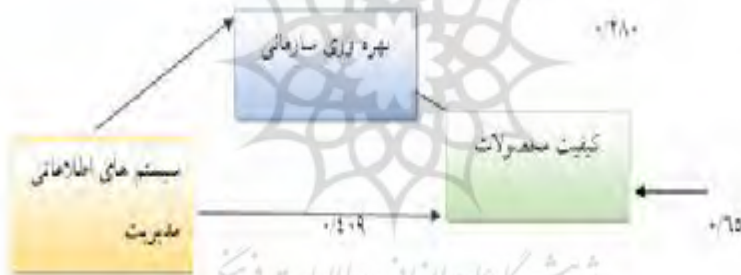
شکل شماره 5. ضرایب نهایی رگرسیون چندگانه

در زیر خلاصه ای از آزمون سایر فرضیات ارائه شده است: