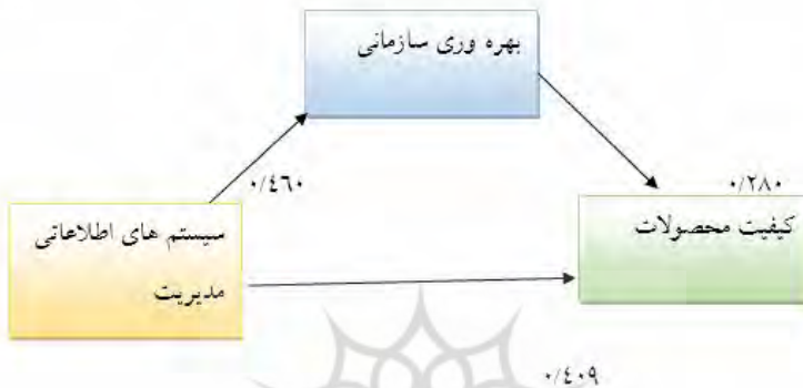
شکل شماره 4. ضرایب نهایی رگرسیون چندگانه

برای محاسبه \beta 2 باید یک بار دیگر آزمون رگرسیون انجام گیرد و این بار ضریب بتای استاندارد بین دو متغیرسیستم‌های اطلاعاتی مدیریتی و بهره‌وری سازمانی محاسبه شود. ضرایب مدل رگرسیون روابط بین سیستم‌های اطلاعاتی مدیریتی و بهره‌وری سازمانی در جدول زیر آمده است: