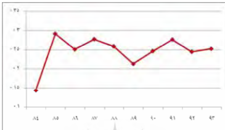
شکل شماره 4- روند تغییرات بهره‌وری کل عوامل

این دو عامل سبب تشدید افت بهره‌وری انرژی شده‌اند. در نتیجه کمترین شاخص بهره‌وری در سال 1389 بوده است.