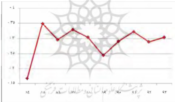
شکل شماره 2- روند تغییرات شاخصهای بهره‌وری سرمایه

روند تغییرات شاخص بهره‌وری سرمایه در شکل 2 آمده است.