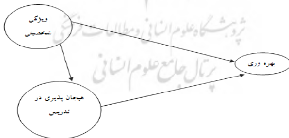
شکل شماره 1: مدل مورد بررسی

مدل مورد بررسی به شرح زیر قابل ارائه می‌باشد: