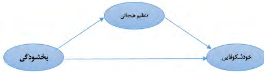
شکل ۱: مدل نظری رابطه‌ی بین «بخشودگی» و «خوشکوفایی» با میانجی‌گری «تنظیم هیجانی»

پس از رسم ساختار بالا در نرم‌افزار LISREL، اضافه نمودن قیود مدل و انتخاب روش ماکسیمم درست‌نمایی، مدل اجرا شده و نمودار مسیر برازش شکل ۲ و مقادیر مربوط به t در شکل ۳ به دست آمد: