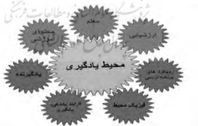
شکل ۱. الگوی مؤلفه‌های مؤثر بر کیفیت محیط‌های یادگیری

پس از فراترکیب چارچوب‌های نظری و پژوهش‌های بررسی شده در زمینه محیط‌های یادگیری، الگوی مفهومی جدیدی به دست آمد.