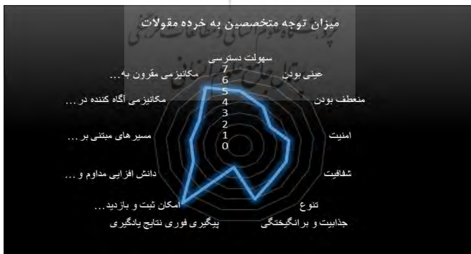
شکل شماره (۳). میزان توجه به خرده مقولات از نظر متخصصین