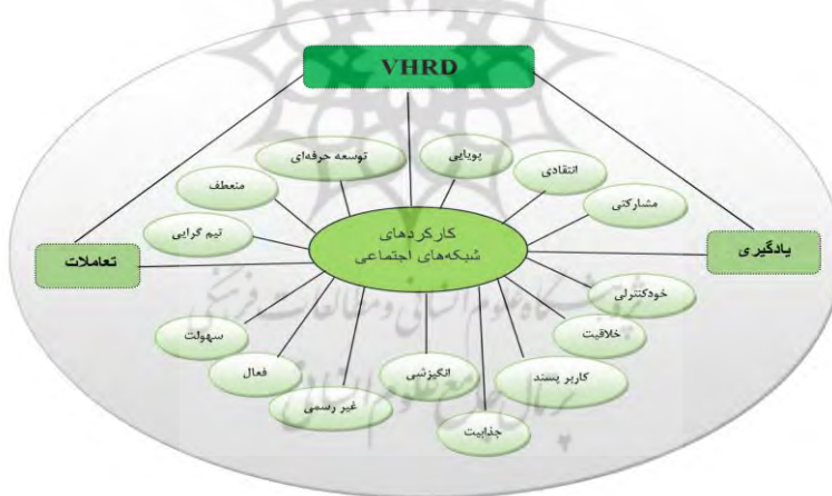
شکل شماره (۱). تصویری شماتیک از مدل مفهومی پژوهش

در واقع حضور فن‌آوری چون شبکه‌های اجتماعی: سطح بالاتری از ارتباطات باز، ایجاد محیط‌های یادگیری، تسهیل فرآیند اجتماعی شدن، ایجاد و تقویت یادگیری غیر رسمی را در آموزش عالی ممکن می‌کنند. در نهایت به عنوان نتیجه‌گیری از پیشینه بررسی شده پژوهش حاضر، می‌توان کارکردهای متعدد شبکه‌های اجتماعی را در مدل مفهومی طبق شکل شماره (۱) بر اساس دو بعد اساسی یادگیری و ساخت اجتماع (تعاملات) برگرفته از رویکرد VHRD در فرآیندهای توسعه منابع انسانی آموزش عالی به صورت شماتیک نشان داد.