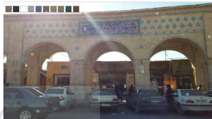
تصویر ۱. رنگ بافت کالبد جداره میدان مشتاق

این میدان در شهر کرمان حد فاصل مسیرهای شریعتی مشتاق، مشتاق کرمان می باشد این میدان یکی از نقاط قوت محور گردشگری استان کرمان است و پیشینه تاریخی دارد. بررسی و تحلیل رنگ بافت کالبد جداره میدان مشتاق توسط نرم افزار Color Schemer Studio صورت گرفته است.