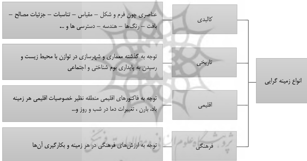
نمودار ۱. انواع زمینه گرایی و اجزاء هر کدام

توجه به زمینه و فاکتورهای اقلیمی که در آن اقدام به معماری می‌کنیم می‌تواند ما را رد رسیدن به یک بنای پایدار نزدیک نماید. این امر می‌تواند استفاده از نیروهای فسیلی را به حد اقل رسانده و استفاده از نیروهای طبیعی را افزایش دهد. همچنین می‌توان با رد نظر گرفتن فاکتورهای اقلیمی منطقه نظیر باد، باران، تغییرات دمای هوا در طی روز و شب و ... در معماری به درک روشن تری از شیوه معماری بناهای بومی رسید و این امر در معماری زمینه‌گرا ضروری می‌باشد (فاضلی حق پناه، ابوالفضل، ۱۳۹۵)