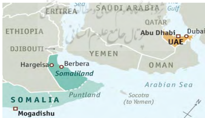
شکل ۳. موقعیت استراتژیک جزایر پانتلند و سومالی‌لند

مالی و سیاسی خود از حکومت فدرال ۱ را قطع کرد. از این زمان به بعد ابوظبی حمایت از مهره‌های دست‌نشانده و مناطق شبه‌خودمختار سومالی‌لند (در سال ۱۹۹۱ به‌طور یک‌جانبه استقلال خود را اعلام کرد) و پانتلند (در سال ۱۹۹۸ استقلال خود را اعلام کرد) و تشکیل دولت موازی را با هدف افزایش فشار بر سومالی در دستورکار قرار داد. دولت شبه‌خودمختار سومالی‌لند در فوریه ۲۰۱۷، موافقت نمود که امارات تأسیسات نظامی خود را در "بربرا" مستقر سازد. این پایگاه که تنها ۹۰ کیلومتر از سواحل یمن فاصله دارد، به نیروهای اماراتی کمک می‌کند محاصره یمن را تکمیل نمایند. منافع منطقه‌ای اتیوپی نیز با موافقت‌نامه بربرا به‌طور قابل توجهی تأمین شده است. بر این مبنای، تضمین یک سومالی تقسیم‌شده و ضعیف به‌مفهوم تبدیل شدن اتیوپی به قدرت بلامنزاع محلی است (Cannon, 2017). امارات آموزش ارتش و پلیس سومالی‌لند را نیز به‌عهده دارد. در ازای دریافت امتیاز استقرار پایگاه‌های نظامی، ابوظبی سرمایه‌گذاری در این دو منطقه شبه‌خودمختار را افزایش داد. «دی.پی.ولد» ۲ در سال ۲۰۱۷، قراردادی به ارزش ۳۳۶ میلیون دلار برای توسعه و مدیریت "بندر بوساسو" به امضا رساند. به‌علاوه، این شرکت اماراتی از اکتبر ۲۰۱۸، بیش از ۴۴۲ میلیون دلار برای توسعه بندر بربرای سومالی‌لند سرمایه‌گذاری کرد (Fenton-Harvey, 2020).