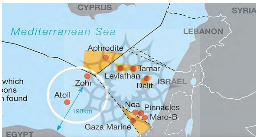
شکل ۲. میدان گازی زهر

سرمایه‌گذاری‌های امارات با جهشی فوق‌العاده به ۶,۶ میلیارد دلار در سال ۲۰۱۸ و ۷,۲ میلیارد دلار در سال ۲۰۱۹ رسید. در جریان دیدار ۱۶ نوامبر ۲۰۱۹، السیسی از امارات و دیدار با محمد بن زاید، طرفین در خصوص سرمایه‌گذاری مشترک ۲۰ میلیارد دلاری در پروژه‌های اقتصادی و اجتماعی توافق نمودند. در مارس ۲۰۱۸ نیز شرکت مبادله پترولیوم ۱۰ درصد از امتیاز میدان عظیم گازی "زهر" در مدیترانه را با مبلغ ۹۳۴ میلیون دلار به دست آورد (بزرگترین میدان گازی مدیترانه با بیش از ۳۰ تریلیون فوت مکعب ذخایر گازی) (Megahid, 2018).