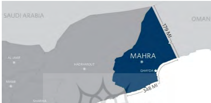
شکل ۵. موقعیت استراتژیک استان المهره یمن

تحركات ابوظبی، سلطان‌نشین عمان تلاش نموده تا با بهره‌گیری از پیوندهای قبیله‌ای و فرهنگی اهالی این منطقه با منطقه ظفار عمان، به آنها تابعیت مضاعف اعطا نماید. افزون بر این، تلاش نموده شورای نجات ملی جنوب ۱ را به‌عنوان اهرمی در برابر شورای انتقالی جنوب مورد حمایت اماراتی‌ها مطرح کند.