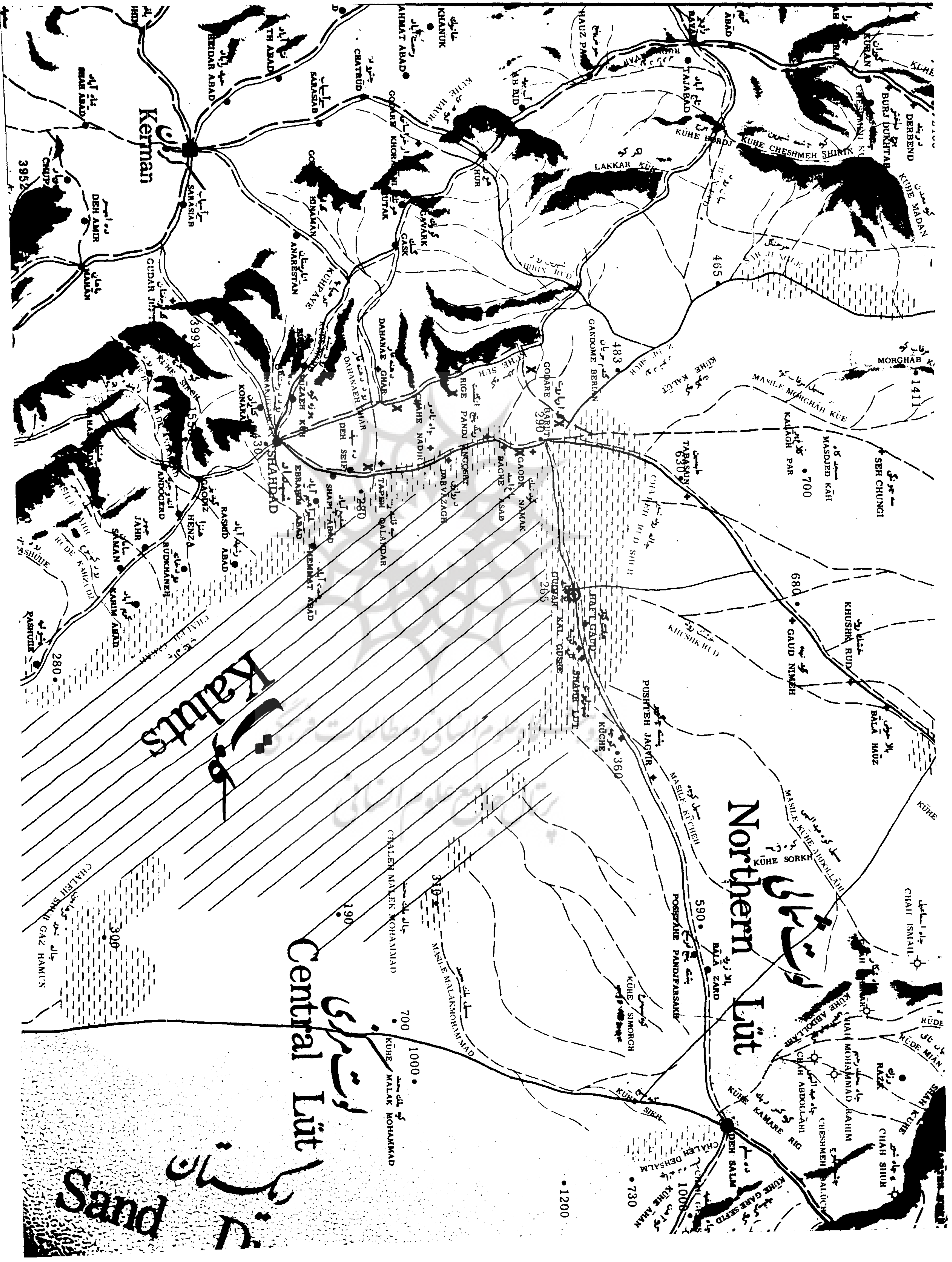
نقشه احوالی لوت مرکزی بین شهداد و کerman