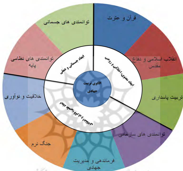
مدل مفهومی تحقیق (الگوی تربیت جهادی دانشجویان دانشگاه افسری و تربیت پاسداری امام حسین (ع))