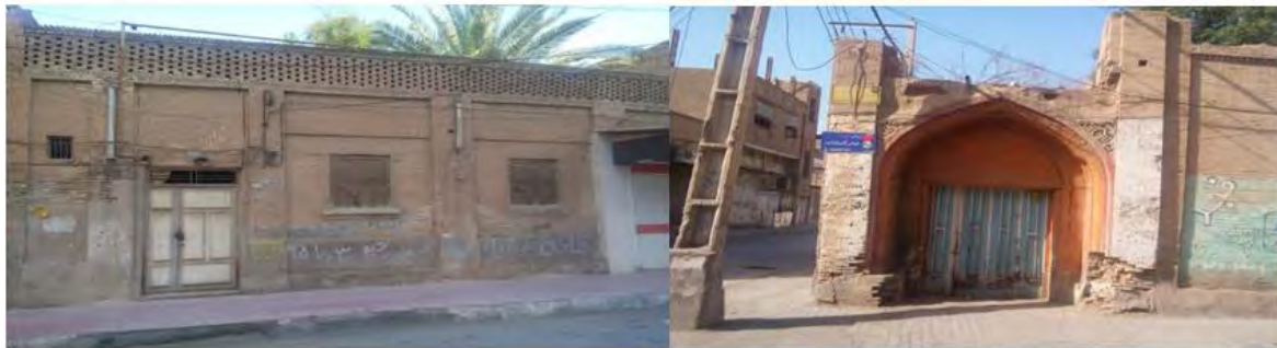
شکل ۴: نمونه خانه بافت ناکارآمد خیابان صدرالسادات