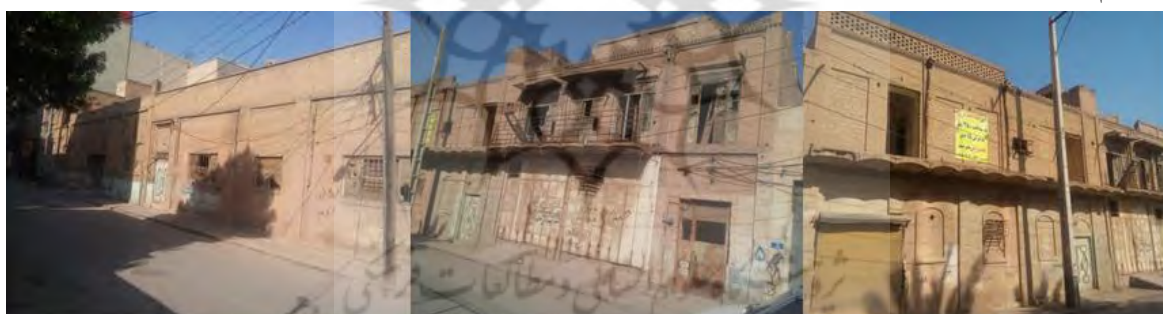
شکل ۳: واحد مسکونی با وسعت ۴۵۰ متر در مرکز شهر اهواز (نگارنده، ۱۳۹۹)

دلایل عمده بروز ترافیک و عدم دسترسی مناسب به محدوده مورد مطالعه حجم بالای تقاضا جهت ورود به هسته مرکزی شهر به دلایل تمرکز مراکز تجاری، درمانی، خدماتی می باشد. که به دلیل وجود فضای کم پارک و یا عرض کم معابر به دلیل قدیمی بودن این بافت و همچنین عدم رعایت سلسله مراتب شبکه دسترسی در این محدوده دانسته که باعث کاهش ظرفیت و ایمنی معابر گردیده است. در بررسیهای صورت گرفته وجود چنین مخروبه هایی در هیچ یک از مراکز اصلی و خرید کلانشهرهای کشور به این شدت و با این تعداد مشاهده نمی شود و تنها در شهرهایی مثل مناطق جنگی و عملیاتی که آنها نیز سهم خوزستان است قابل مشاهده است.