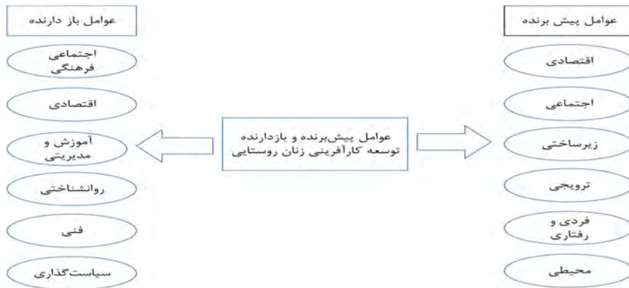
شکل ۳. عوامل پیش برنده و بازبرنده توسعه کارآفرینی زنان روستایی (جمشیدی و همکاران، ۱۳۹۳)