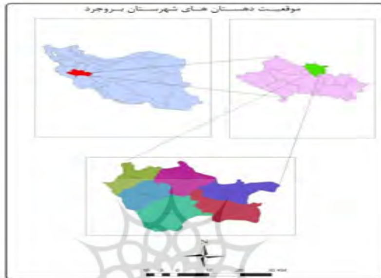
شکل ۱: موقعیت شهرستان بروجرد

برابر با ۳۵۵۸۷۶ نفر داشته است که حدود ۷۰ درصد آن را ساکنین نقاط شهری و ۳۰ درصد را نقاط روستایی تشکیل می‌دهند. تعداد مردان و زنان در شهرستان بروجرد تقریباً مساوی است.