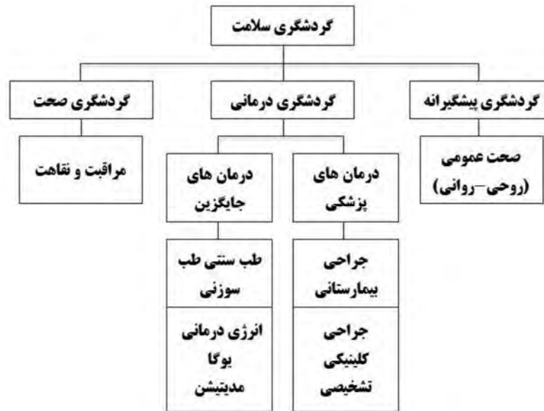
شکل شماره ۱: تقسیم‌بندی گردشگری سلامت.