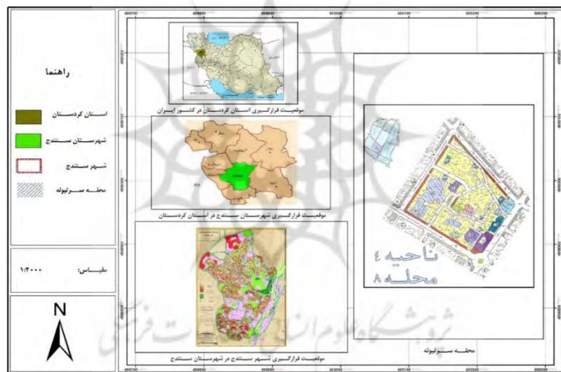
شکل ۱- موقعیت جغرافیایی محله سرتپوله

محله‌ی سرتپوله در مرکز بافت قدیم شهر واقع شده است و از شمال به محله جورآباد بالا و پایین، از جنوب به مرکز شهر و محور تجاری خیابان امام خمینی، از شرق به خیابان طالقانی و محله چهار باغ و از غرب به قلعه چوارلان و محور تجاری خیابان امام خمینی و مسجد جامع سنندج محدود شده است. محور اصلی محله را راسته بازار آن تشکیل می‌دهد که دارای نقش فرامحله‌ای است. ارتباطات محله با سایر نقاط شهر از طریق خیابان‌های امام خمینی، طالقانی و شهدا صورت می‌گیرد که این خیابان‌ها در ارتباط با گذرهای اصلی از نظر دسترسی درون محله‌ای دارای دو محور اصلی هستند که یکی گذر و راسته بازار سرتپوله است و دیگری گذر شمالی جنوبی است که محور اولی را قطع می‌کند. مرکز محله به صورت خطی در امتداد گذر اصلی از مسجد هاجر خاتون تا خیابان شهدا امتداد دارد. با تطبیق محدوده محلات قدیم و سنتی شهر سنندج با نقشه تقسیمات رسمی شهر سنندج و نواحی و محلات آنها، محله سرتپوله با مساحتی بالغ بر ۱۳۷۹۸۳ متر مربع، ۱۳٫۵ درصد از مساحت کل محدوده را به خود اختصاص داده و در ناحیه ۴ از منطقه ۱ شهر سنندج قرار دارد.