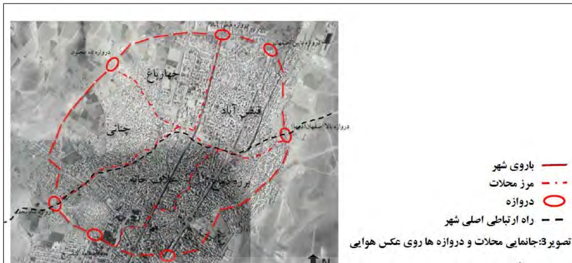
شکل شماره (۳): موقعیت محلات قدیمی شهر کرمانشاه

شاه نجف منتهی می‌شد. «درحوالی بازار توپخانه (در طویله) در سمت جنوب غرب میدان اصلی یک مرکزیت فرعی نیز شکل گرفته که محل اسکان زوار بود و حمام‌ها، مساجد، کاروانسراها و خرده فروشی‌ها در آنجا متمرکز بودند. از اینرو همچون محله فیض آباد شامل کاروانسراها و حمام‌های متعددی بوده است (مرادی و الماسی، ۱۳۹۲).