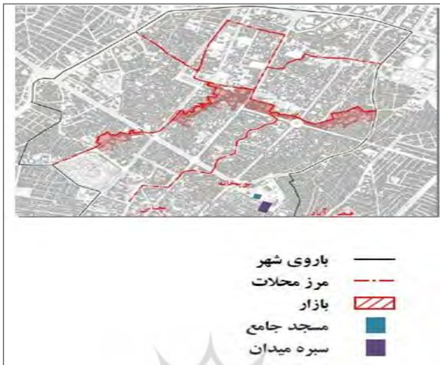
شکل شماره (۴): موقعیت بازار تاریخی شهر کرمانشاه