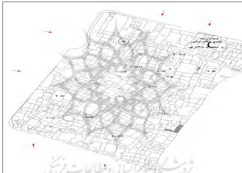
شکل شماره (۱): موقعیت محلله فیض‌آباد شهر کرمانشاه

محلۀ فیض‌آباد، یکی از محلله‌های قدیمی واقع در بافت قدیمی شهر کرمانشاه است. این محلله یکی از روستاهای قدیمی‌ای است که بافت تاریخی شهر کرمانشاه از به هم پیوستن‌شان تشکیل شده است. فیض‌آباد در منطقه سه شهرداری کرمانشاه قرار دارد. محلله فیض‌آباد به مساحت ۶۴/۳۲ هکتار، نزدیک به ۱۲ درصد هسته تاریخی ۲۸۵ هکتاری شهر کرمانشاه را تشکیل می‌دهد. جمعیت فیض‌آباد نزدیک به ۵۶۰۰ نفر تخمین زده می‌شود. این محلله از سمت شمال به خیابان امیری (کاشیکاری)، از سمت غرب به خیابان مدرس (سپه)، از سمت شرق به خیابان جلیلی و میدان آقا شیخ هادی جلیلی (میدان لاهوتی)، و از جنوب به خیابان نواب (رشید یاسمی) محدود می‌شود. با ساخت خیابان امام جمعه در مسیر سبزه میدان، میان فیض‌آباد و بخشی از این محلله تاریخی که در مجاورت محلله آبشوران قرار داشت، فاصله افتاد. اما همچنان پهنه تاریخی آن سبزه میدان را نیز در بر می‌گیرد و از جنوب به خیابان نواب محدود می‌شود ( https://fa.wikipedia.org ).