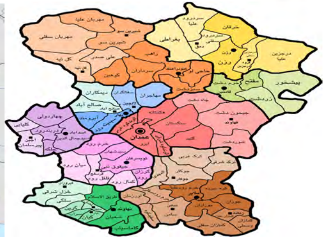
شکل شماره ۲- موقعیت جغرافیایی دهستان الوند غربی در شهرستان همدان