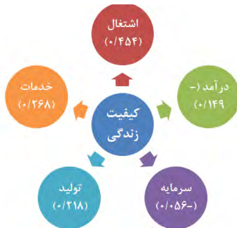
شکل (۲): اثرات کیفیت زندگی در اقتصاد شهری