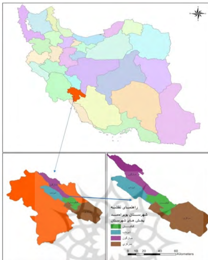
شکل (۲) نقشه‌ی موقعیت محدوده‌ی مورد مطالعه در کشور