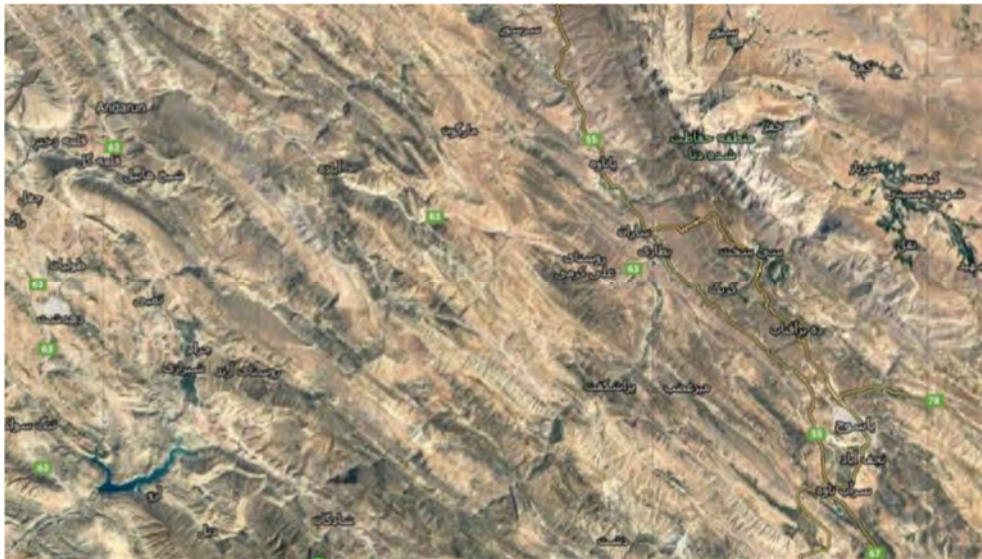
شکل (۲) عکس هوایی روستاهای منطقه مورد مطالعه