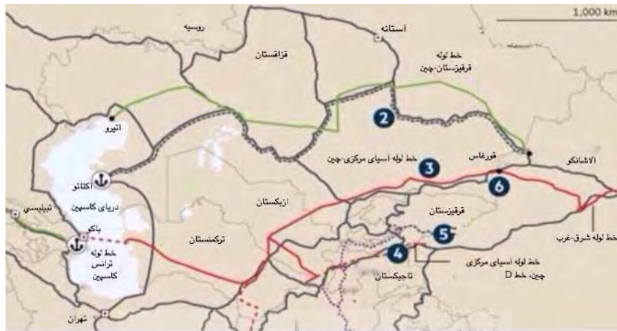
نقشه ۲. خطوط لوله نفت و گاز در آسیای مرکزی و منطقه خزر