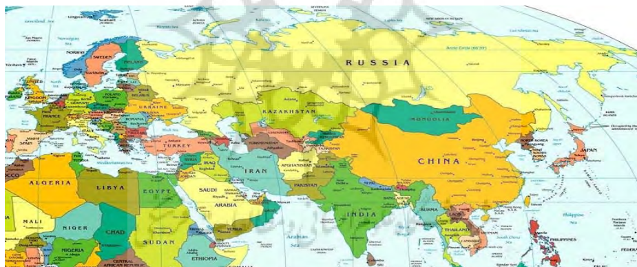
نقشه ۱. موقعیت جغرافیایی اوراسیا

شمار می‌رود. در واقع، شاخص‌های مختص مناطق راهبردی جهان را باید در این منطقه جستجو کرد. این اهمیت به میزانی است که مکیندر می‌گوید: «هر قدرتی که بتواند بر اوراسیا مسلط شود، می‌تواند جهان را کنترل کند» (Nazemroaya & Halliday, 2012: 67-68). اهمیت اوراسیا از نقطه نظر استراتژیک توسط ژینگنو برژینسکی چنین بیان شده است: «اوراسیا ابرقاره محوری در جهان است. قدرتی که بر اوراسیا مسلط شود، نفوذ قطعی بر دو تا از سه منطقه عمدتاً اقتصادی جهان یعنی اروپای غربی و آسیای شرقی خواهد داشت. نگاهی کوتاه به نقشه جهان نشان می‌دهد که هر کشوری که بر اوراسیا مسلط شود به طور خودکار بر خاورمیانه و آفریقا هم مسلط می‌شود و کنترل این مناطق را در اختیار خواهد داشت. با توجه به اینکه اوراسیا هم‌اکنون به مثابه صفحه شطرنج ژئوپلیتیکی سرنوشت‌ساز عمل می‌کند؛ این دیگر کفایت نمی‌کند که بر روی یک سیاست برای اروپا و یک سیاست برای آسیا متمرکز شویم. هر آنچه که در رابطه با توزیع قدرت در سرزمین اوراسیا اتفاق افتد؛ برای برتری جهانی و میراث تاریخی آمریکا از اهمیت حیاتی برخوردار می‌باشد» (Phil, 2018: 5).