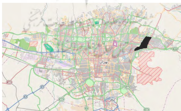
شکل ۲. محدوده مورد مطالعه بوستان پلیس در منطقه ۴ تهران

بوستان پلیس در شمال شرقی تهران و در منطقه ۴ و ناحیه ۹ واقع شده است. این بوستان در محلی با نام باغ مجیدآباد (باغ اناری) که به کمک خیابانی ۳۵ متری به دو قسمت تقسیم شده است، در سال ۱۳۸۲ احداث شد. دو قسمت پارک با یک پل عابر پیاده با هم ارتباط دارند. بخش شمالی این بوستان، به دلیل داشتن درختان فراوان انار به باغ اناری معروف بوده است. برای افزایش امنیت در این بوستان و به دلیل افتتاح آن در هفته پلیس این بوستان را بوستان پلیس نام گذاری کرده‌اند (خاکی، ۱۳۸۸: ۱۱۶). طراحی این بوستان به سبک باغ‌های ایرانی است. در این بوستان، محورهای طولی و عرضی عمود بر هم، استخرهای زاویه‌دار همراه با جریان آب، راه‌های مستقیم و منظم هندسی به چشم می‌خورد. تنها معابر درجه ۳ فرعی به صورت نامنظم طراحی شده‌اند که تقریباً می‌توان سبک طراحی آن را منظم دانست. پوشش گیاهی این بوستان شامل انواع درختان کاج و سرو تبریزی، اقاچیا، بیدمجنون، میخک هندی، زرشک، یاس زرد، شمشاد، زیتون، توت و غیره است. مساحت این پارک ۵۱۶٫۶۶۳ مترمربع است که قطعه شمالی آن حدود ۲۷ هکتار و قطعه جنوبی حدود ۲۴ هکتار است. این بوستان دارای مقبره شهدای گمنام، عمارت تاریخی هرمز، کتابخانه، سینما شش‌بعدی، آمفی‌تئاتر، بوفه، زمین بازی، زمین ورزشی، آلاچیق، برکه، آب‌نما، چشمه، وسایل بدن‌سازی، مسجد و سرویس بهداشتی است (سازمان بوستان‌ها و فضای سبز شهر تهران، ۱۳۸۸).