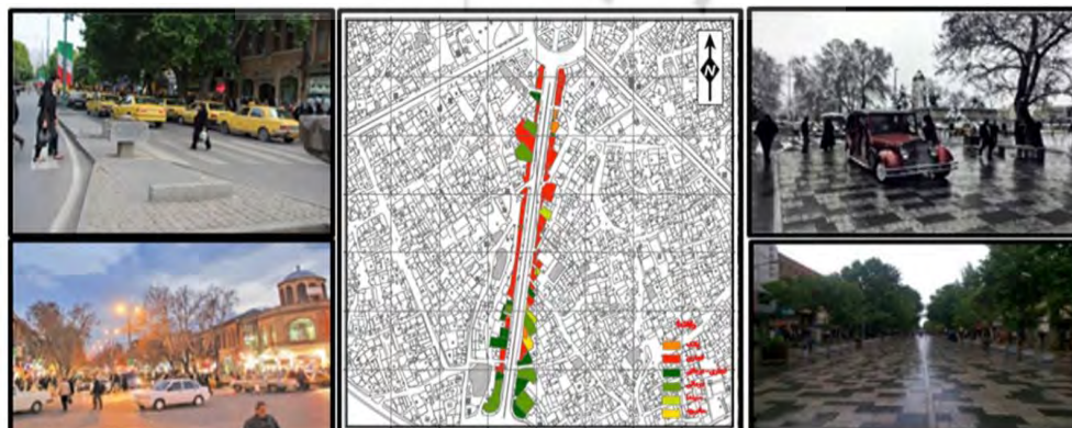
شکل ۱. نقشه کاربری و نماهایی از پیاده‌راه بوعلی

کاربری غالب در محور بوعلی شامل کاربری‌های تجاری است، اما کاربری‌های فرهنگی و درمانی نیز در آن به‌چشم می‌خورد و به همین دلیل شهروندان حضور چشمگیری در طول ساعات روز در این خیابان دارند. پس از تبدیل خیابان بوعلی به پیاده‌راه شهری، شاهد رونق در برگزاری آیین‌های جمعی، جشنواره‌ها، اعیاد مذهبی و رویدادها و وقایع مختلف فرهنگی و اجتماعی در فضا هستیم. قرارگیری محور در محدوده مرکزی و در ارتباط با استخوان‌بندی اصلی شهر، نفوذپذیری کالبدی و بصری مطلوبی را برای آن فراهم کرده است. عمده آلودگی‌های بصری در این خیابان به‌دلیل پراکندگی تابلوهای مطب پزشکان و نامنظمی خط آسمان در این محدوده است.