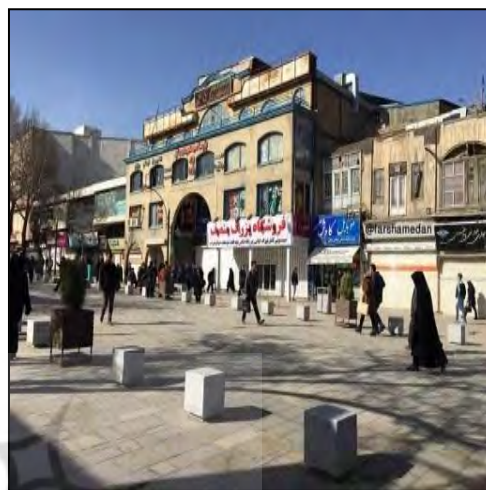
شکل ۴. سنجش مؤلفه هویتی - معنایی