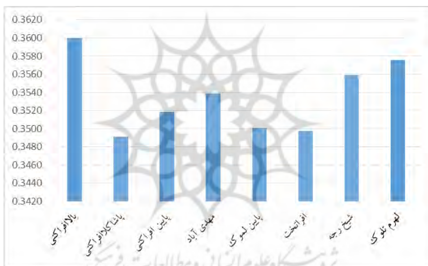
شکل ۳. نمودار نتیجه مدل واس پاس در روستاهای مورد مطالعه