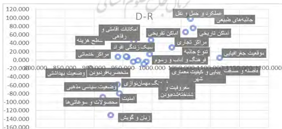
شکل ۲. نمودار علی عوامل

محور افقی نمودار (D+R) و محور عمودی (D-R) است؛ با توجه به اینکه اگر برای یک عامل (D-R) مثبت باشد، آن عامل تأثیرگذار و اگر منفی باشد، آن عامل تأثیرپذیر است، پس در شکل ۱ نقاطی که بالای محور افقی اند تأثیرگذار و نقاطی که زیر محور افقی اند تأثیرپذیرند.