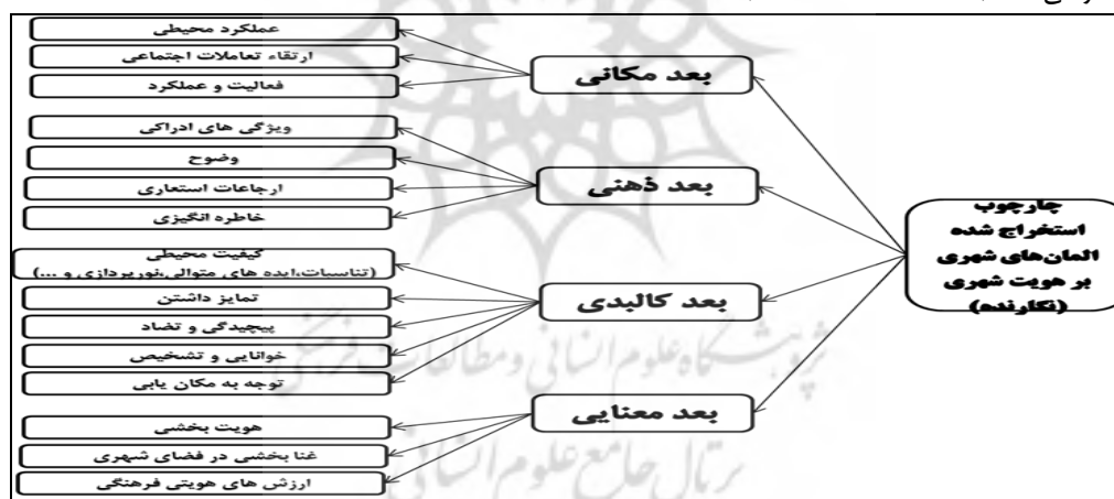
شکل ۱- ابعاد و شاخص های تأثیرگذار استخراج شده المان های شهری بر هویت شهری - منبع: یافته های تحقیق، ۱۳۹۷.

هویت شهری و المان ها: لینچ مفهوم "هویت" را در معنای بسیار ساده یعنی "مکان" تعریف می کند. هویت یعنی حدی که یک شخص می تواند یک مکان را به عنوان مکانی متمایز از سایر مکان ها مورد شناسایی قرار دهد به گونه ای که شخصیتی منحصر به فرد داشته باشد و هویت را به همراه ویژگی های دیگری نظیر ساختار، شفافیت، سازگاری و خوانایی عاملی می داند که معنی مکان را در نظر ناظر شکل می دهند (Mabhout, 2014). هویت، واحدی است که شخص می تواند یک مکان را به عنوان مکانی متمایز از سایر مکان ها شناخته و بازشناسایی کند. به دلیل قرار گرفتن نشانه ها برپایه تاریخ، فرهنگ، آداب و رسوم و زمینه، نشانه ها در شهر بیانگر هویت شهر هستند. (Bahreyni et al, 2010: 43). در مورد استفاده نشانه ها و نمادها در شهر باید دقت شود که یک طرف نماد، تعبیر مردم است. در واقع پیچیدگی معنای محیط در این است که معانی نمادین محیط تنها به کیفیت کالبدی آن بستگی ندارد این معانی به عوامل دیگری نیز وابسته هستند که از مهمترین آنها می توان به افراد بهره بردار و فعالیت هایی که در محیط انجام می شود اشاره کرد. از این رو نمادها و المان های شهری و عناصر شاخص از جمله بناها و عوامل مهم در طراحی معماری و طراحی شهری محسوب می شوند، که علاوه بر بازگو کردن ویژگی های هر شهر تأثیر مهمی در نحوه برخورد و تعاملات شهروندان با یکدیگر و محیط شهری را دارند. نمادهای مختلف در مناطق مختلف دارای معانی متفاوتی می باشند که قبل از طراحی هر نمادی، طراح باید ویژگی های نمادین و هویتی آن منطقه را شناخته و بر آن اساس طراحی کند (Mabhout, 2014: 29).