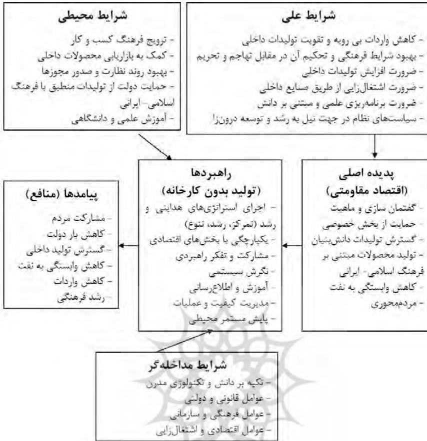
شکل ۲- مدل راهبردهای تولید بدون کارخانه برای تحقق اهداف اقتصاد مقاومتی

هر یک از این مقوله‌ها نیز به نوبه خود شامل تعدادی مفاهیم و ابعاد بوده‌اند که به عنوان نمونه مقوله‌ها، مفاهیم و ابعاد مربوط به پیامدها مطرح می‌شود. پیامدها شامل ۶ مقوله، ۱۲ مفهوم و ۲۰ بعد به شرح زیر بوده است: