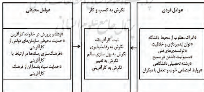
شکل ۱- مدل مفهومی پژوهش برای عوامل موثر بر نگرش به کسب و کار در میان دانشجویان بسیجی