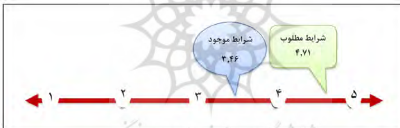
نمودار شماره ۱- میزان بهره‌گیری در وضع موجود و مطلوب

* میزان بهره‌گیری در وضع مطلوب ۲۲۵,۹۲ \div ۱۰۶۶,۰۷ = ۴,۷۱